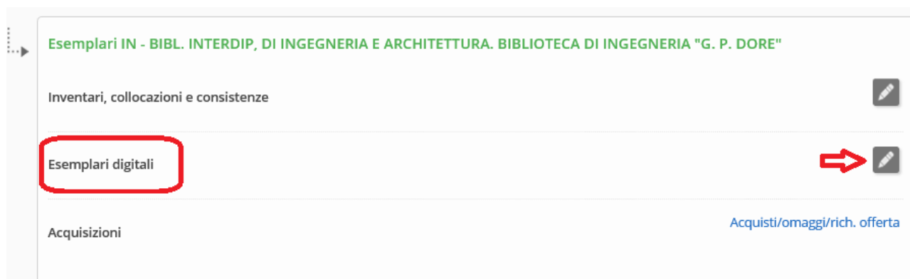
Figura 3 Inserimento di un esemplare digitale